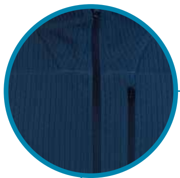
Diseño cierre completo

Polar térmico / Fabricado con tejido stretch , para mayor confortabilidad / Tiene tratamiento antipilling que evita la aglomeración de pelusas producto del roce / Su diseño triangular y cierre frontal lo caracterizan como una prenda versatil y dinámica , adaptable a distintos requerimientos que involucren protección y flexibilidad / Las canaletas de ventilación permiten una mayor termicidad/respirabilidad y regulación del calor corporal .