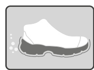
RESISTENTE A LOS HIDROCARBUROS Y SUS DERIVADOS