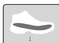
PLANTILLA DE ARMADO ANTIPERFORANTE