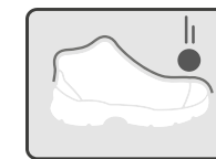
RESISTENTE A IMPACTOS