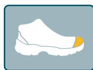
PUNTERA DE FIBRA DE VIDRIO