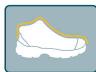
RESISTENTE A IMPACTOS