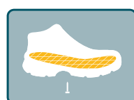
PLANTILLA TEXTIL ANTIPERFORANTE