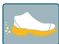
RESISTENTE A LOS HIDROCARBUROS Y SUS DERIVADOS