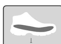
PLANTILLA DE ARMADO ANTIPERFORANTE