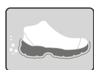
RESISTENTE A LOS HIDROCARBUROS Y SUS DERIVADOS