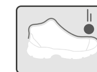
RESISTENTE A IMPACTOS